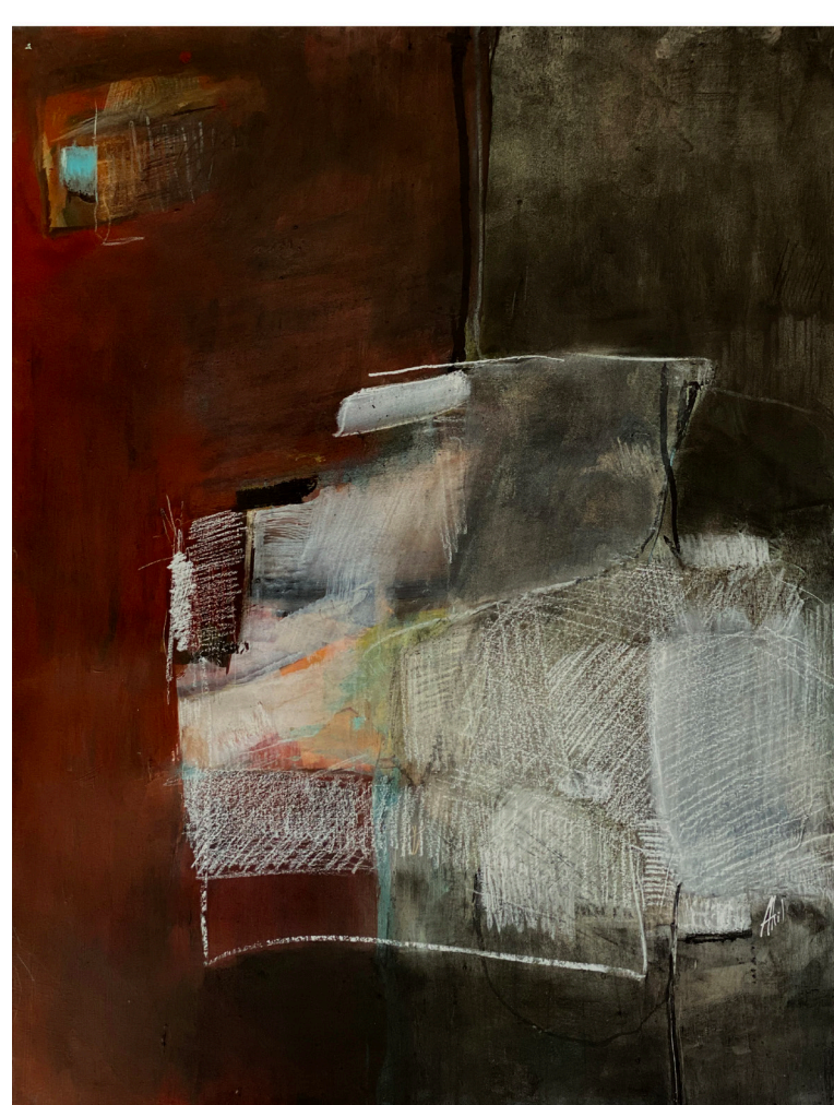
Un monde à repenser