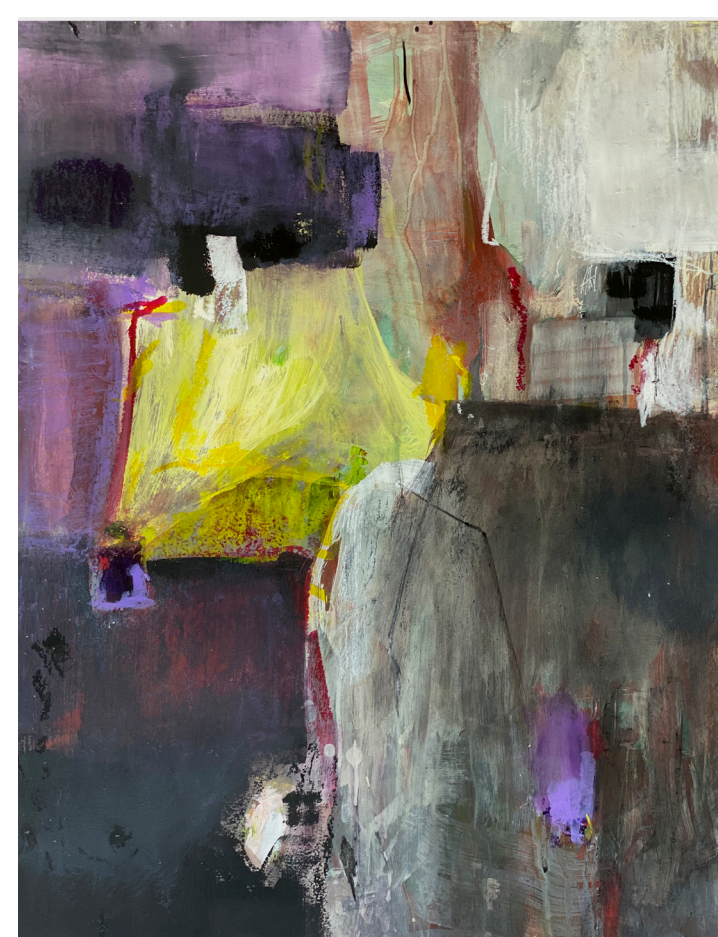
Repenser le temps