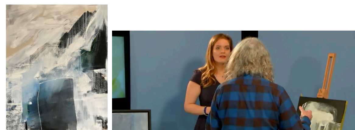
Performance en direct pour LMTV