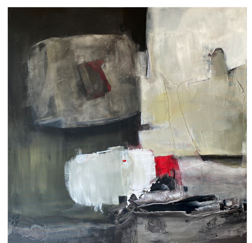
Et après le silence