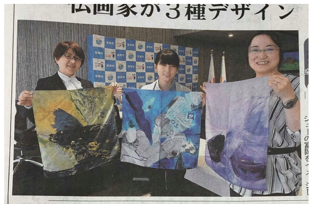
Création de carrés de soie Tomioka, Japon