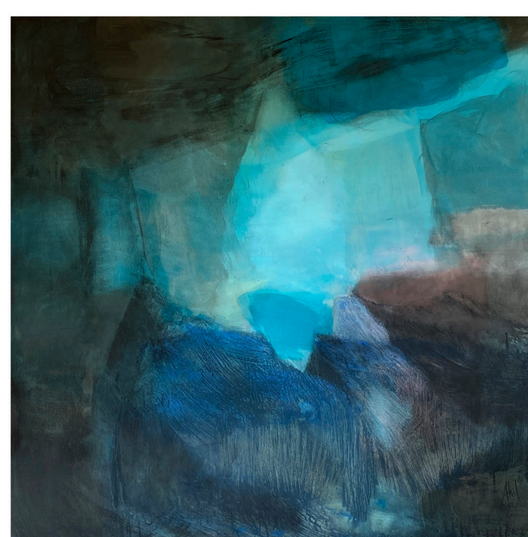
L'ombre du vent